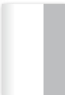
1/3 strony pion 74 x 295 mm 4 900 zł