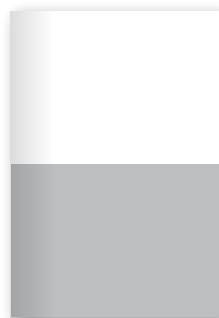
1/2 strony 220 x 147 mm 6 900 zł