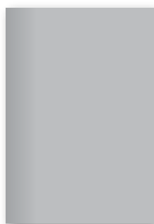
Strona 1/1 nr 05/07 220 x 295 mm 14 900 zł